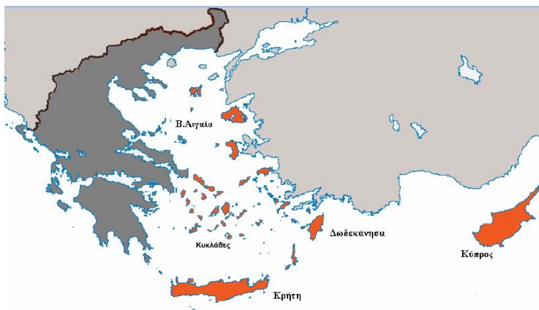
Πίνακας 1: Επιλέξιμες περιφέρειες στο πλαίσιο του προγράμματος συνεργασίας INTERREG V-A ΕΛΛΑΔΑ-ΚΥΠΡΟΣ 2014-2020

Η περιοχή του Προγράμματος, βρίσκεται σε πλεονεκτική γεωγραφική θέση στο χώρο της Νοτιοανατολικής Μεσογείου, καθώς συνδέει την περιοχή της Ευρώπης με τη Μέση Ανατολή και τη Βόρεια Αφρική, ενώ αποτελεί την πύλη εισόδου-εξόδου της ΕΕ σε τρίτες χώρες. Επίσης, κατέχει ιδιαίτερα σημαντική θέση, όσον αφορά την ανάπτυξη των σχέσεων της Ευρωπαϊκής Ένωσης με τα υπόλοιπα κράτη της Μεσογείου στο πλαίσιο της Ευρω-Μεσογειακής συνεργασίας και κομβική θέση στο πλαίσιο της ανάπτυξης της «θαλάσσιας λεωφόρου» της Νότιο-Ανατολικής Ευρώπης.